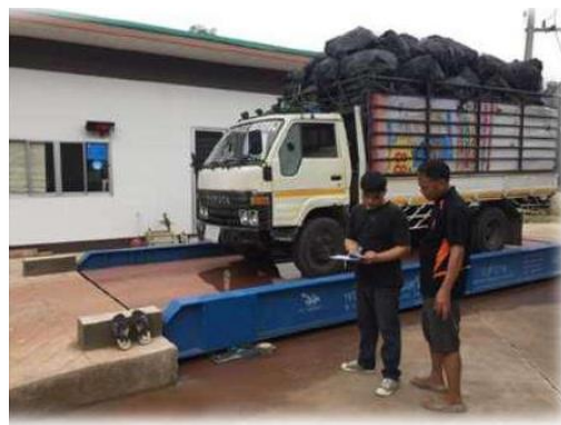
เชื้อเพลิง RDF ที่ขายให้กับโรงปูนซีเมนต์