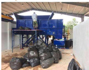
คัดแยกส่วนหน้า