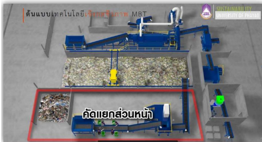
ต้นแบบเทคโนโลยีเชิงกลชีวภาพ MBT