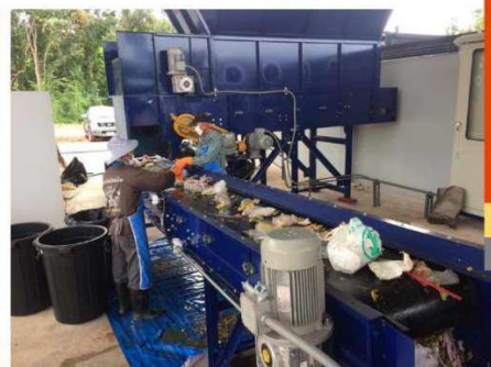
ภาพ 21 การคัดแยกขยะส่วนหน้า