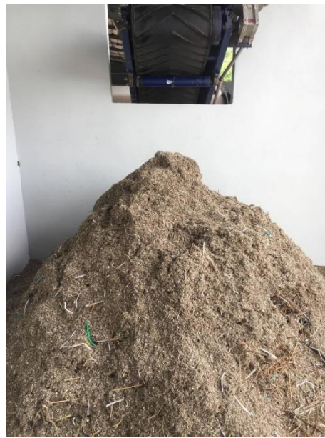
แบบละเอียด